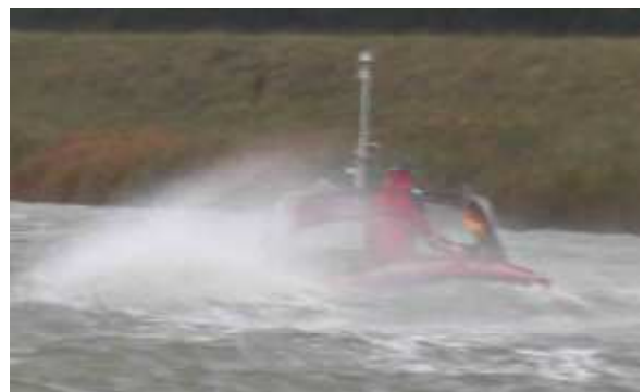
Nicht nur der erste Herbststurm ließ die Veranstaltung zu einer stürmischen Sache werden (im Bild STEK UT)...