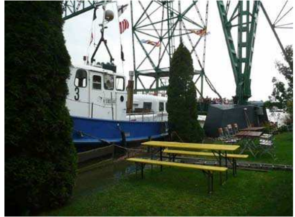
Die OTTENSTREUER machte bei starkem Hochwasser in den Rabatten des Hotels Fährkrug fest.