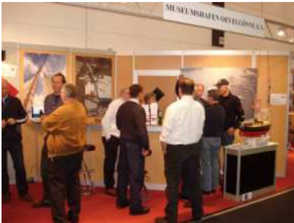
Museumshafen-Standparty 2008 auf der Hanseboot