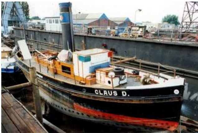
CLAUS D. 1995 bei „Jugend in Arbeit“ in Harburg

Bis zur tatsächlichen Realisierung des neuen Dampfkesselbaus in den Schlepper, benötigt der Verein von der stolzen Gesamtinvestitionssumme von 150.000 EUR allerdings noch ca. 20.000 EUR für die Umbauten. Vielleicht sehen Sie Möglichkeiten, sich noch in die Reihe der großzügigen Spender einzureihen? Sie können dem Museumshafen Oevelgönne e.V. unter dem Betreff „CLAUS D.“ eine Spende auf das Vereinskonto zukommen lassen: