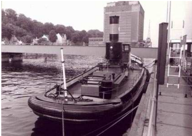
CLAUS D. im Museumshafen Oevelgönne ca. 1984