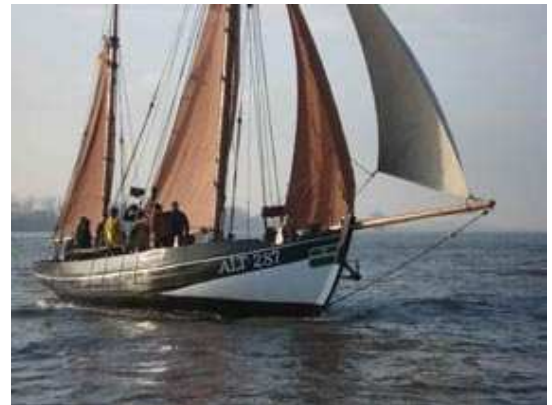
Die „CATARINA“ von der „Stiftung Hamburg Hamburg Maritim“ ging als erste über die Ziellinie

Am 14.12.2008 segelten vier Schiffe, bei herrlichem Wind und Wintersonne um den Preis des Konsul Klöben! Schon heute lädt der Museumshafen Oevelgönne e.V. für 2009 zur 30.Regatta ein und bittet um rege Teilnahme!