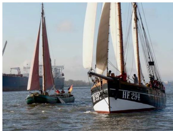
Skutsje FORTUNA und PRÄSIDENT FREIHERR VON MALTZAHN

Am 3.Advent 2009 veranstaltete der Museumshafen Oevelgönne zum 30. Mal die Konsul Klöben Gedächtnisregatta. Bei Sonne, blauem Himmel und schwachen Winden aus Ost segelten 7 Schiffe elbaufwärts bis zur Hafencity. Neben Titelverteidiger "CATARINA" von 2008 begleitete diesmal auch der Dampfschlepper TIGER die Geschwaderfahrt.