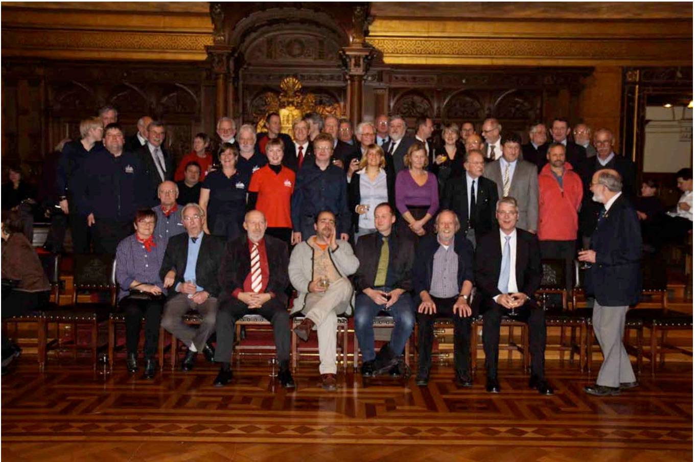
Aktive Mitglieder des Museumshafen Oevelgönne e.V. im großen Festsaal des Hamburger Rathauses.