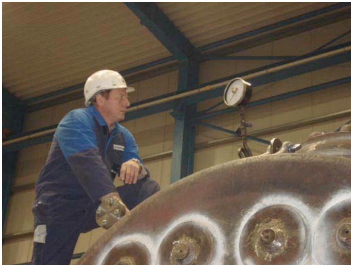
Der TÜV-Sachverständige nimmt eine Wasserdruckprüfung mit 24 bar vor.